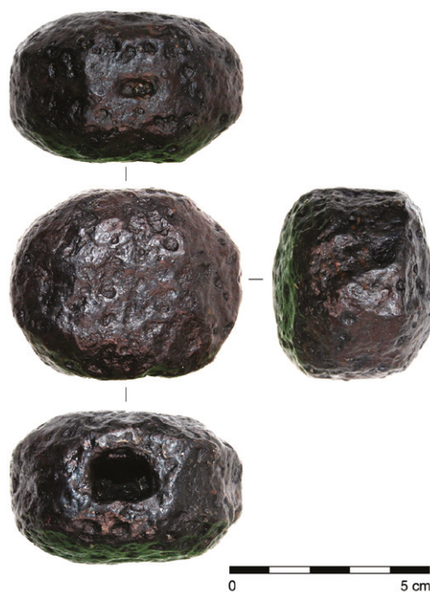
Obr. 21. Hlavice dlouhého meče z přelomu 14. a 15. století z hradu Hlubokého.

Na základě morfologických znaků lze celkem jednoznačně předmětný artefakt klasifikovat jako hlavici typu I, které se objevují na mečích zejména od poloviny 13. století (Oakeshott 1964, 96), byť na základě některých severských nálezů lze uvažovat o jejich výskytu již v průběhu 12. století a možná i dříve (např. Leppäaho 1964, 58, 60, Taf. 27, 28; Oakeshott 1964, 96; 2002, 37; Moilanen 2017, 23, Fig. 16:2). Daný typ hlavic patří obecně k jedněm z nejrozšířenějších typů mečových hlavic vůbec, přičemž jejich náhodné nálezy se jen stěží blíže datují, neboť jejich obliba při konstrukci krátkých i dlouhých mečů přetrvávala až do poloviny 15. století.